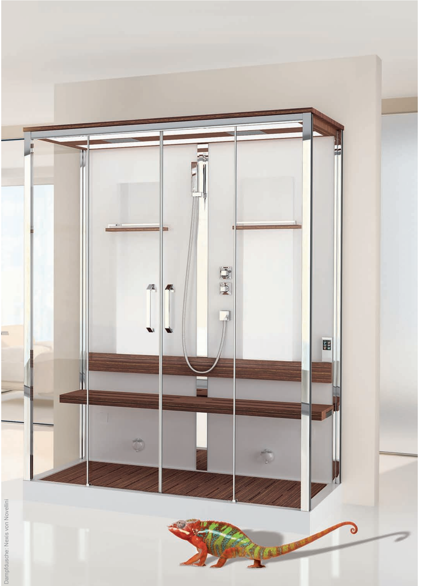
Dampfdusche: Nexis von Novellini