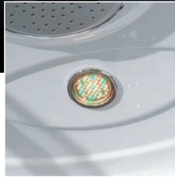
Version Chromolight plus 120 x 98 x H 225 cm